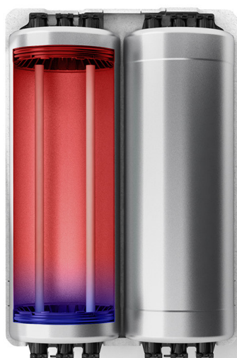
Nerezové vrstvené zásobníky s technológiou IsoDyn3

Vďaka najnovšej verzii IsoDyn3, inteligentnej technológii nového kotla Tiger Condens, sa kotol dokáže učiť podľa zvykov vašej domácnosti a rozpozná, kedy a v akom množstve teplú vodu najviac potrebujete.